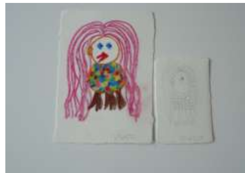
* Yさんがコロナ対策プログラムの中で描いた「アマビエ」です

通所しない日(自宅待機)には、課題を出すことにしました。依存症に関するテキストから課題を出し、自分の依存症に関する振り返りをして感想を書いてくる。ほかに、今日1日の食事とやった事、そして朝と昼の検温を記載することとしました。利用者のかたは、確実に課題に取り組みました。読んで感じたこと、自分はどうだったか、そして今はどうなのか、しっかりと記入してきました。「今日何食べたか」、「何をして過ごしたか」は休みの日の様子を知ることができました。通所をしている時間だけではわからなかった日常を垣間見ることができ、今後の支援に活かしていく必要がありそうです。