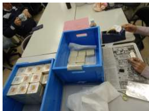
*出荷前の「万能石鹼すご腕くん」

通所を通して自分が一番変わったと思うことは、人にありがたうとか挨拶ができるようになったことです。感情はまだまだブレやすいです。でも、自分にとってすとおりは大事な居場所です。無力な自分ですが、すとおりは楽しいし、みんなのことが大好きです。みんなと一緒に過ごせるように、健康に気を付けて通所をしていきます。