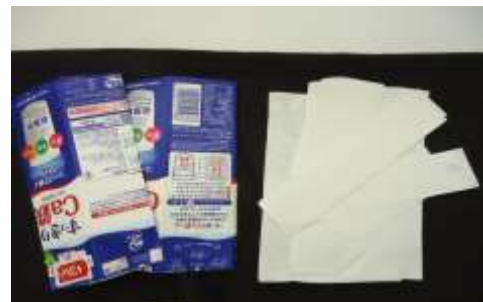
*牛乳パックの表面のコーコーディングをはがした状態