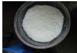
* 攪拌機にかけてドロドロに