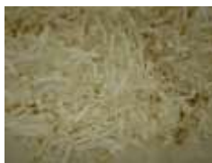
* 細断後の牛乳パック