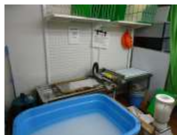
* 慶祝カードを漉いています