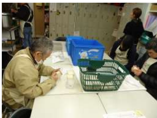
*「万能石鹼すご腕くん」の製作中 Sさんは、石鹼づくりのプロ

私は、小さいころから、人と接することが大変少なく、学校に行ってもみんなと仲良くなれませんでした。なぜ相手とうまくできないのか、いろいろ考えたりしました。すとおりに通所して7年