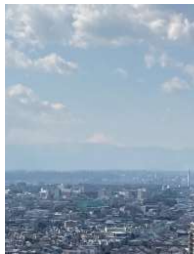
天气が良いと富士山も見えて最高です！