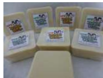
*すご腕くん 税抜き価格 1個100円 です。

まだお使いにならなかったことのない方は、是非とも改良された『万能石鹼すご腕くん』を、一度使ってみてください。