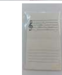
二つ折りメッセージカード 封筒付き (1セット120円税抜き)