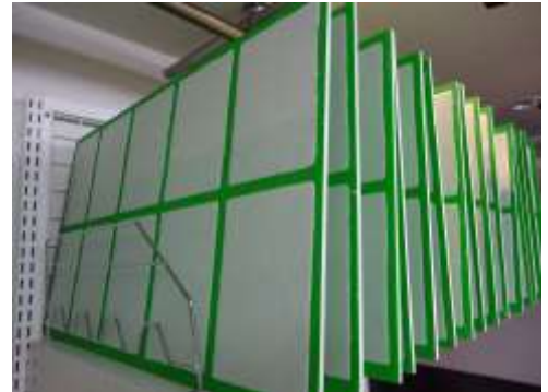
*はがきをデコレーションパネルに貼りつけて干しているところです。

また、塩山ファクトリー様に教えて頂いた方法で、パルプに段ボールを混ぜて何パターンか手漉きはがきの試作品を作ってみました。原料のゴミが気にならないだけでなく、和紙の雰囲気が増し手漉きの良さが際立つ製品になりました。近々、製品化していきますので、店頭に並ぶ日を楽しみにして下さい。