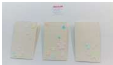
ポチ袋 (1枚50円税抜き)

是非、すとおりのお店や販売会などでお求めになって下さいますようお願い申し上げます。