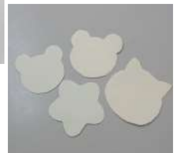
色々な形のメッセージカード