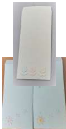
多当袋 (1枚100円税抜き)