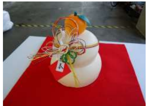
*この鏡餅、実は食べられません。 すご腕くんできているからです。